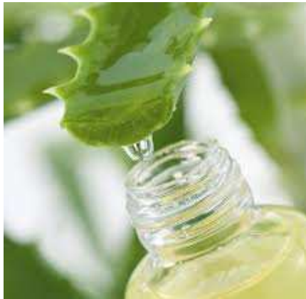
Gambar 5. Sari daun aloe vera banyak dimanfaatkan dalam industri kecantikan dan farmasi.

Dari ke-3 (tiga) HS Code yang dibahas sebelumnya, terlihat bahwa produk Indonesia yang sudah memasuki pasar Hongaria adalah produk HS 12119086 (sebelumnya 12119085) yaitu Plants and parts of plants, incl. seeds and fruits, used primarily in perfumery, in pharmacy or for insecticidal, fungicidal or similar purposes, fresh or dried, whether or not cut, crushed or powdered (excl. ginseng roots, coca leaf, poppy straw, genus ephedra and tonquin beans) . Produk ini adalah tumbuhan atau bagian dari tumbuhan aloe vera segar, dikeringkan, dalam bentuk powder maupun yang sudah dihancurkan. Produk ini tergolong raw material tanpa pengolahan lanjutan yang dapat memberi nilai tambah, dan hanya menjadi bahan pokok bagi berbagai jenis industri. Dari sifatnya yang masih berupa bahan mentah tersebut tentu produk ini memiliki bea masuk yang lebih rendah, namun dengan konsekwensi harga jual yang juga lebih rendah bila dibandingkan dengan produk jadi yang siap dikonsumsi.