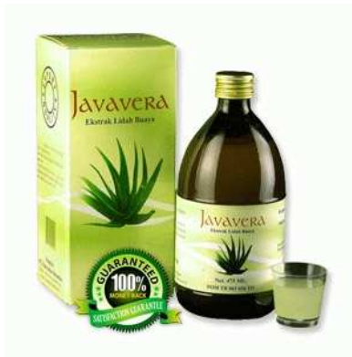
Gambar 6. Produk minuman kesehatan berbahan dasar aloe vera dari Indonesia.

Melihat nilai ekspor negara-negara competitor lain seperti China, India dan Malaysia atas produk jadi dan semi-jadi HS 13021970 dan HS 21069098, hal ini tentu disayangkan mengingat industri pengolahan aloe vera di Indonesia juga sudah sangat berkembang dengan pesat, didukung dengan ketersediaan bahan baku