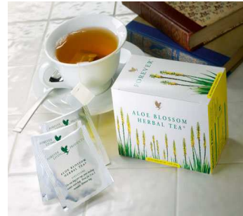
Gambar 2. Berbagai produk minuman dari sari aloe vera yang beredar di Hongaria.