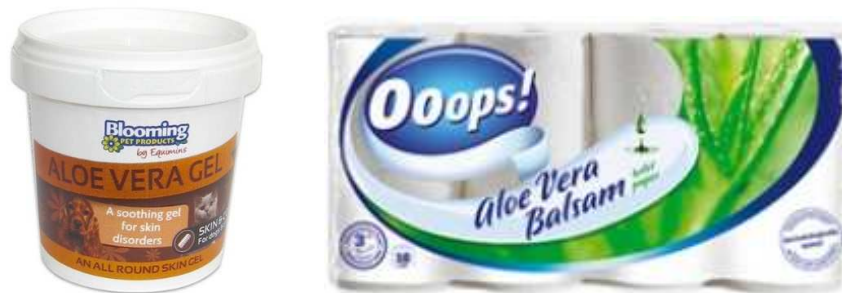
Gambar 1. Berbagai produk dengan kandungan aloe vera yang beredar di Hongaria: krim medicated gel untuk hewan dan toilette tissue.

Trend untuk mengkonsumsi produk makanan sehat di Hongaria ikut mempengaruhi meningkatnya minat masyarakat Hongaria atas produk makanan dan minuman yang diproduksi dari bahan-bahan alami seperti aloe vera . Produk-produk tersebut ada yang diproduksi secara lokal maupun diimpor dari negara Eropa lainnya maupun dari Asia seperti China.