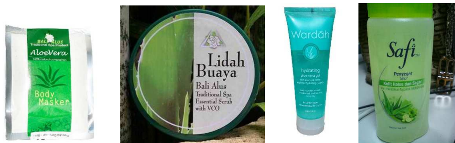
Gambar 8. Berbagai produk kecantikan yang memanfaatkan khasiat aloe vera dari Indonesia

Beberapa produk olahan aloe vera Indonesia juga sudah memiliki kualitas yang tidak kalah dengan produk-produk buatan luar negeri, baik itu yang berupa produk makanan maupun produk kesehatan dan kecantikan. Beragamnya variasi produk aloe vera terutama jenis produk minuman segar sari lidah buaya di Indonesia dan tingginya minat pasar Hongaria tentu merupakan celah yang harus dapat dimanfaatkan oleh pengusaha Indonesia untuk memasarkan produknya ke Hongaria.