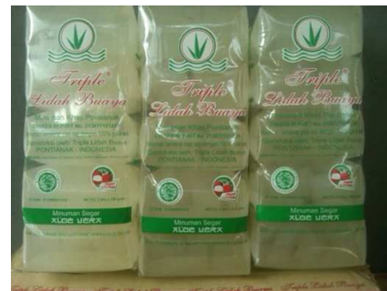
Gambar 7. Berbagai produk minuman segar sari aloe vera dari Indonesia

Lidah buaya atau aloe vera sudah dikenal khasiatnya di Indonesia sejak lama. Masyarakat Indonesia memanfaatkan lidah buaya terutama karena khasiatnya yang dapat menyuburkan rambut, mendinginkan kulit yang terbakar dan menghaluskan kulit. Namun saat ini produk yang