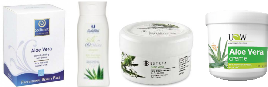
Gambar 4. Produk-produk kecantikan berbahan dasar aloe vera di Hongaria.

Khasiat aloe vera dalam mendinginkan dan melembabkan kulit banyak diminati oleh industri farmasi untuk memproduksi berbagai produk kosmetika seperti sabun mandi, shampoo, jelly dan krim pelembab kulit hingga bahan tambahan pada produk toilette tissue . Selain produk-produk untuk manusia, produk-produk kesehatan untuk hewan berbahan dasar Aloe vera pun sudah beredar di Hongaria. Dalam hal ini, prdouk yang diimpor adalah ekstrak Aloe Vera maupun yang masih berupa produk raw material yang tergabung dalam HS 12119086 dan HS 13021970-80.