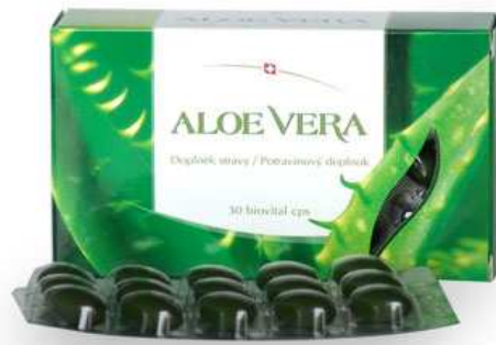
Gambar 3. Produk Sari aloe vera yang dikemas dalam bentuk soft capsule .