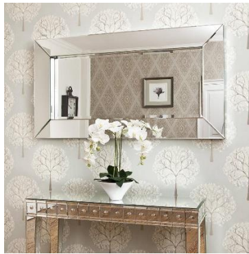
Gambar 1 Berbagai contoh produk cermin kaca dengan rangka atau bingkai