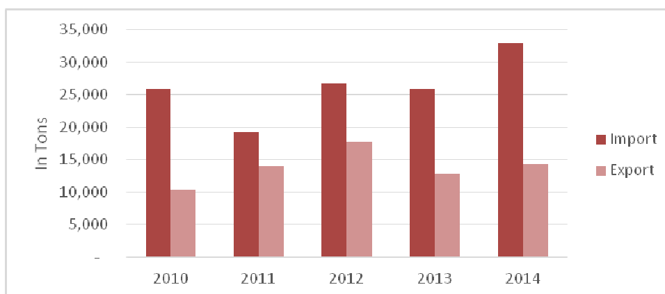
Grafik 2. Perbandingan kuantitas ekspor dan impor produk kopi - HS 0901 Hongaria periode 2010-2014 (sumber: Intracen, diolah)

Demikian pula untuk produk kakao dan olahannya, selain melakukan impor Hongaria juga mengekspor kembali produk-produk terkait ke luar negeri. Data perdagangan negara tersebut selama periode tahun 2010-2014 menunjukkan angka impor yang lebih tinggi dari ekspor, hal ini menunjukkan bahwa untuk memenuhi kebutuhan akan produk-produk kakao Hongaria masih harus bergantung pada impor.